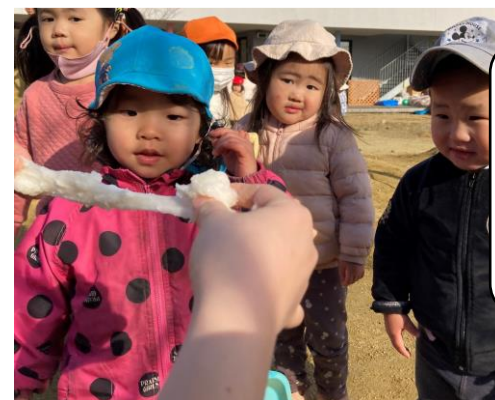
つきたての伸びる お餅に興味津々の 子ども達でした。

日本の伝統文化に触れる機会や、食物の実りや収穫に感謝する気持ちを育てたいという思いから、当法人では毎年、杵と臼を使い餅つきを行っています。職員が餅をついていると、自然と子ども達が集まり、餅つきの真似をしたり、マスクをしながら、「よいしょ〜！」と掛け声でパワーを送ったりしていました。3歳以上児の子ども達は、きなこしようゆで、つきたての餅をいただきました。