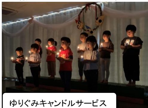
ゆりぐみキャンドルサービス

厳かな雰囲気の中、「感謝と祝福」をテーマにクリスマス会を開催しました。みんなの優しい気持ちが集まった“よろこびの木”の活動や、クリスマス制作、光遊びなどを通して、当日までの過程を楽しんできた子ども達。「ありがとう」と「おめでとう」の気持ちを、改めて考えたり感じたりできるように過ごしてきました。クリスマス会当日は、ワクワクとドキドキがいっぱい詰まった一日になりました。