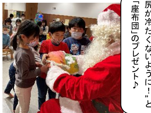
「座布団」のプレゼント♪ 尻が冷たくないように！」と ゆりぐみからサンタさんへ「お