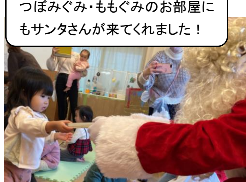
つぼみぐみ・ももぐみのお部屋にもサンタさんが来てくれました！