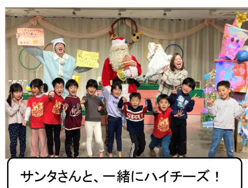
サンタさんと、一緒にハイチーズ！