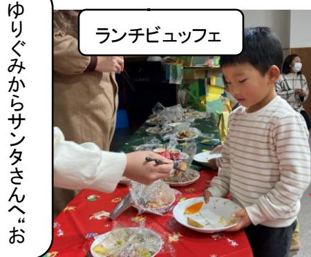
ランチビュッフェ