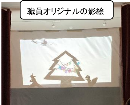
職員オリジナルの影絵